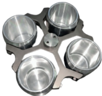
Rotor 4 B