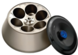
Rotor de Angulo Fijo