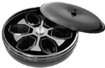
Rotor 12 B con WindShield