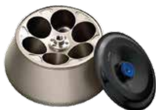
Rotor de Angulo Fijo (R6A)