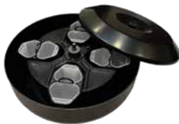
Rotor 8 B con WindShield